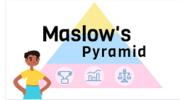
Piramide Di Maslow