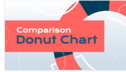
Infografica Grafico Torta