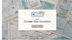
Quiz Scopri Il Paese