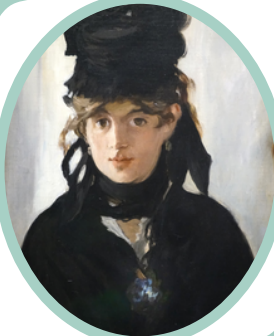
Berthe Morisot con un ramo de violetas de Édouard Manet (Museo de Orsay, París)

Fue una pintora francesa. Fue cofundadora del movimiento artístico del Impresionismo.