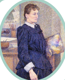
Anna Boch nel suo Atelier di Theo van Rysselberghe

Fu una pittrice belga. Fu l'unico membro femminile del gruppo artistico Les XX.