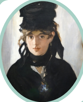
Berthe Morisot au bouquet de violettes by Édouard Manet (Orsay Museum, Paris)

Γαλλίδα ζωγράφος. Ήταν μία από τους ιδρυτές του καλλιτεχνικού κινήματος του Ιμπρεσιονισμού.