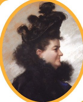
Portrait of Emilia Pardo Bazán by Joaquín Vaamonde Cornide.

Ισπανίδα κόμισσα και συγγραφέας. Είναι γνωστή γιατί εισήγαγε το νατουραλισμό στην Ισπανική Λογοτεχνία.