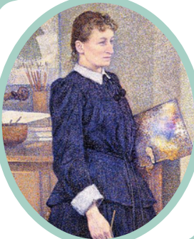
Anna Boch in her Atelier by Theo van Rysselberghe

Βελγίδα ζωγράφος. Ήταν η μόνη γυναίκα που υπήρξε μέλος της καλλιτεχνικής ομάδας Les XX.