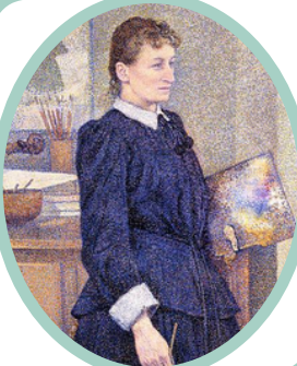
Anna Boch de Theo van Rysselberghe.

Anna Boch était une peintre belge. Elle était la seule femme du groupe artistique Les XX.