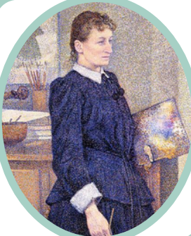
Anna Boch in her Atelier by Theo van Rysselberghe

Belga festőművész. Ő volt a Les XX művészcsoporthoz egyetlen női tagja.