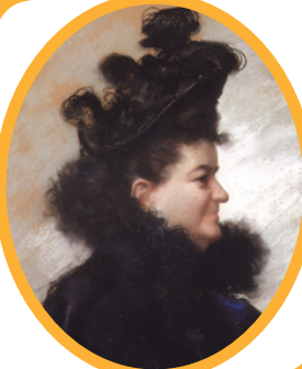
Portrait of Emilia Pardo Bazán by Joaquín Vaamonde Cornide.

Contesă și scriitoare spaniolă. A fost remarcată pentru că a introdus curentul naturalist în literatura spaniolă.