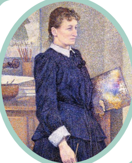
Anna Boch in her Atelier by Theo van Rysselberghe

Pictoriță belgiană. A fost singura femeie care a făcut parte din grupul artistic Les XX.