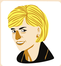
..... Diana Spencer ..... (1961-1997) .....

|| | ..... Ήταν η πρώτη σύζυγος του βασιλιά Καρόλου του 3ου. .....